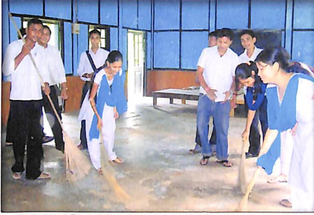
কৰ্মৰত অৱস্থাত N. S. S.ৰ ছাত্ৰ-ছাত্ৰীসকল