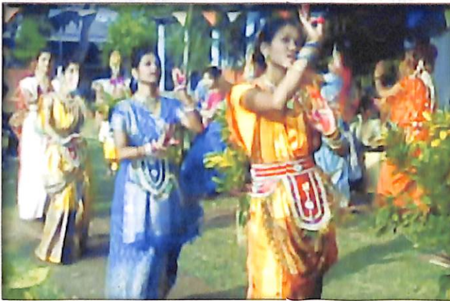
মহাবিদ্যালয়ত অনুষ্ঠিত 'বাস নৃত্যৰ' এক মনোমোহা দৃশ্য।