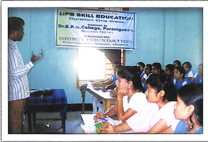
Life Skill Education কৰ্মশালাত অংশগ্রহণকাৰী প্ৰশিক্ষক তথা ছাত্ৰ-ছাত্ৰীসকল।